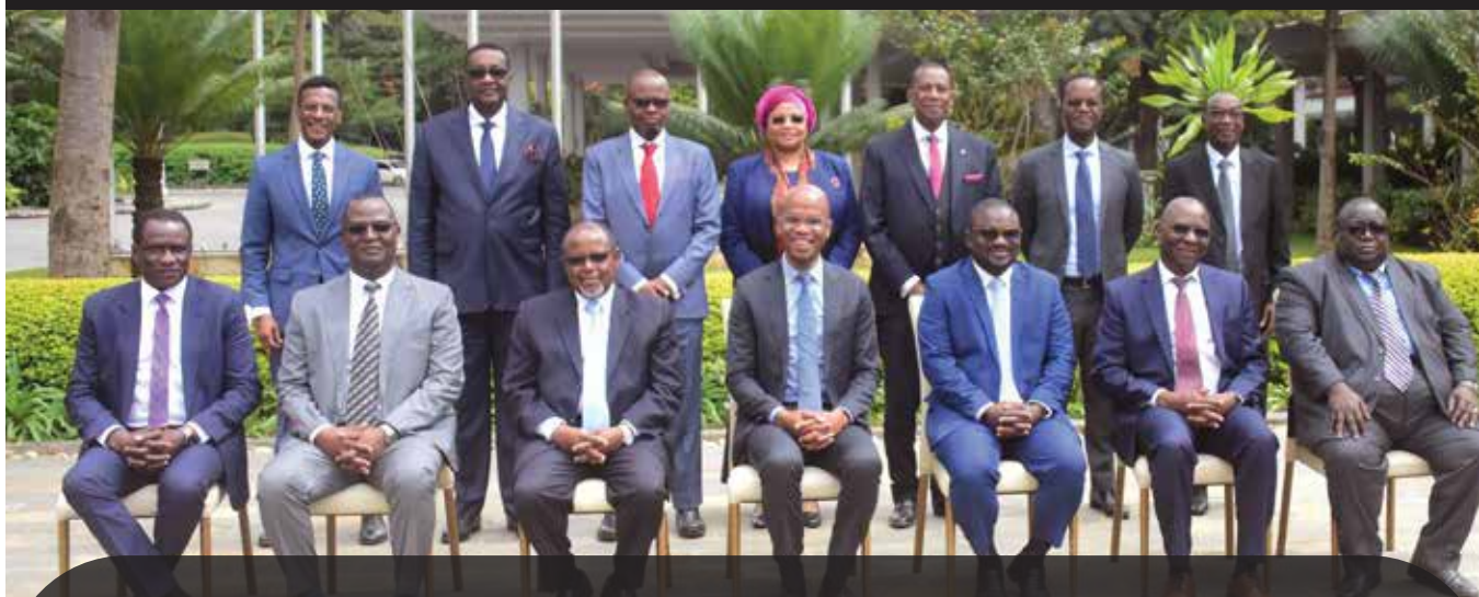
Waziri wa Nishati Mhe. January Makamba akiwa katika picha ya pamoja na Wajumbe wa Bodi ya Shirika la Maendeleo ya Petroli Tanzania (TPDC)