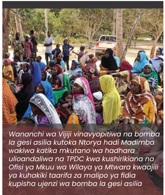
Wananchi wa Vijiji vinavyopitiwa na bomba la gesi asilia kutoka Ntorya hadi Madimba wakiwa katika mkutano wa hadhara ulioandaliwa na TPDC kwa kushirikiana na Ofisi ya Mkuu wa Wilaya ya Mtwara kwaajili ya kuhakiki taarifa za malipo ya fidia kupisha ujenzi wa bomba la gesi asilia

Mradi wa bomba la gesi asilia lenye urefu wa kilometa 35 kutoka Ntorya hadi Madimba na kugusa kata 5 na vijiji 13 ndani ya Tarafa ya Ziwani iliyoko Wilaya ya Mtwara unategemewa kugharimu kiasi cha shilingi bilioni 70.